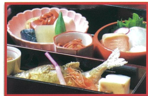
和洋折衷弁当(イメージ)